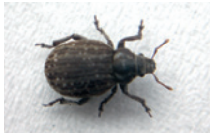
Foto 3. De grijze bolsnuitkever (5-8 mm groot) vreet aan de bladeren van jonge bietenplanten.

De grijze bolsnuitkever (foto 3) vreet planten al aan in het jonge plantstadium. Deze snuitkever lijkt veel op de taxuskever, maar is kleiner (5-8 mm groot). Hij vreet voornamelijk aan de bladeren.