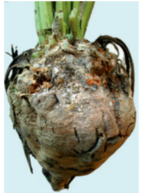
Foto 4. Koprot veroorzaakt door het stengelaaltje. Op foto 5 is te zien hoe dit er aan de binnenkant uitziet.

Ook in het najaar kwamen enkele bietenmonsters binnen met koprot, veroorzaakt door het stengelaaltje (foto 4). Bij een lichte aantasting is dit moeilijk te zien. Bovenaan de kop ontstaat verkurkt weefsel met verticale scheurtjes. Snijdt men een dun plakje van de biet af, dan zijn bruine vlekjes in de biet te zien (foto 5). Bestrijden van het stengelaaltje is moeilijk. Schade in bieten is te beperken door